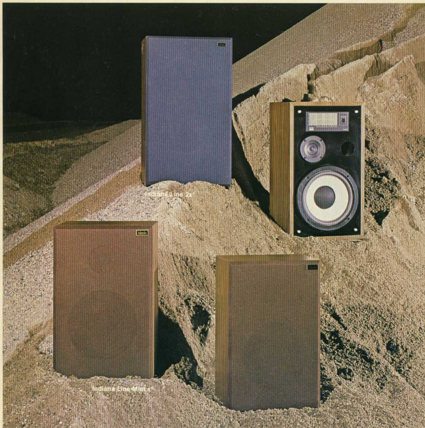
Indiana Line 2x