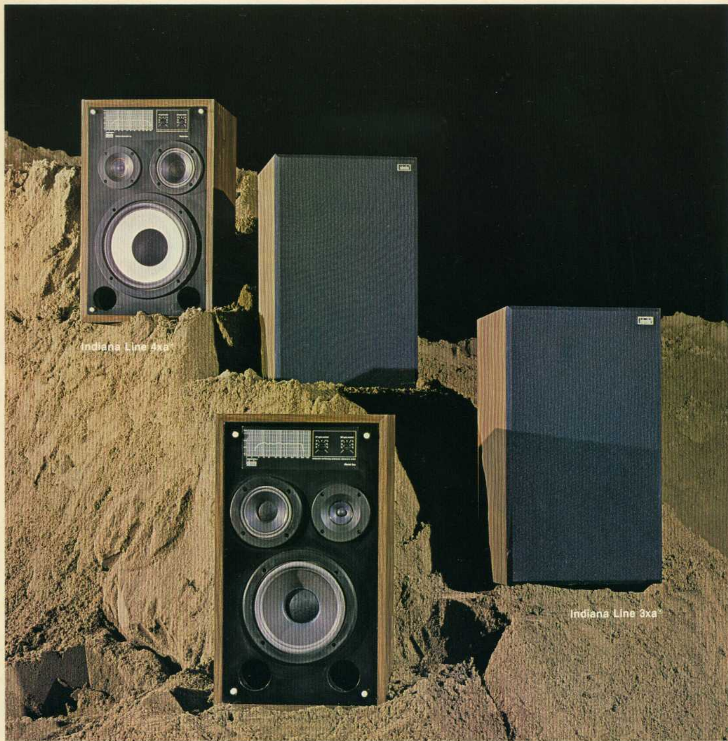
Indiana Line 4xa®